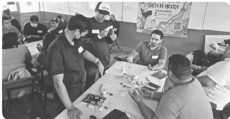
"Intercambiando puntos de vista entre jóvenes pescadores". Encuentro Regional de Juventudes por la Pesca. Región Golfo. Agosto 2022.

nidades de vida, con el propósito de crear espacios para que las personas participantes pudieran dialogar sobre las problemáticas y desafíos que enfrentan, reconocer y reivindicar su papel en la actividad pesquera, y compartir las soluciones implementadas en sus comunidades. Una característica distintiva fue la integración entre una diversidad de jóvenes provenientes de distintos lugares geográficos, con trayectorias y experiencias particulares y aspiraciones comunes. Algunos/as provenían de familias que por generaciones se han involucrado en las pesquerías, o eran integrantes de alguna cooperativa; había pescadores libres,