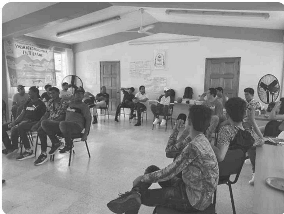
"La escucha activa como parte del intercambio de experiencias". Encuentro Regional de Juventudes por la Pesca. Región Pacífico Sur. Septiembre 2022.

Las comunidades de vida buscan trascender las lógicas individualizantes de la modernidad para ser motores sociales que construyen y defienden modos de vida particulares, de allí su relevancia en el contexto de las juventudes pesqueras. Las y los jóvenes se dieron cuenta de su propio potencial y de la posibilidad de trascender los esquemas que los atrapan, valorando la importancia de reconocer las habilidades, saberes y experiencias del otro/a, para defender el modo de vida al que pertenecen en la pesca, el cual ha sido negado y desvalorizado. Las palabras de un joven en Sisal, Yucatán, en 2022, nos ayudan a entender este planteamiento: "Por lo que en muchas ocasiones sufrimos como pescadores, no queremos que nuestros hijos pasen por eso. Hay personas que estudian y consiguen un título profesional, pero al final terminan en la pesca, no porque no con-