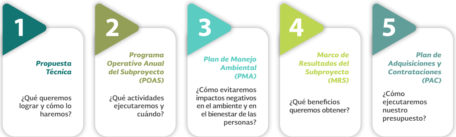
Figura 3: Instrumentos para la planeación, ejecución y monitoreo de subproyectos en el contexto del MDE

sus actividades, medidas de mitigación y resultados, así como la ejecución y comprobación del recurso financiero. Este expediente está integrado por 5 instrumentos clave, revisados y validados de manera participativa con los beneficiarios de subproyectos ( Figura 3 ), asegurando con ello la apropiación de los instrumentos al interior de cada grupo de trabajo y el desarrollo de capacidades para su uso en la planeación y reporte de actividades y metas.