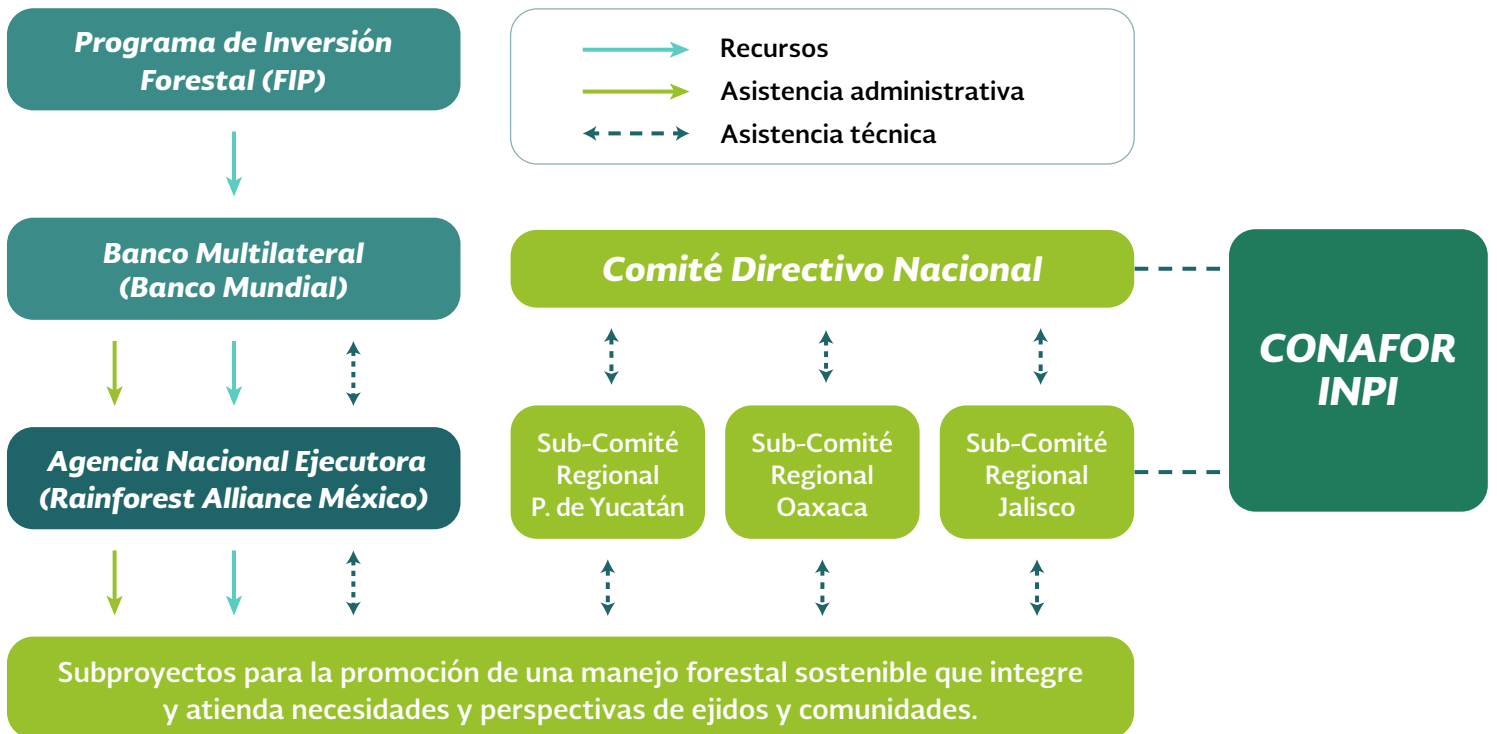
Figura 1. Estructura de Gobernanza del MDE

Una vez que se recibieron las solicitudes para los distintos mecanismos de apoyo, el equipo de la ANE 2 facilitó el proceso para la evaluación y selección de beneficiarios . Para realizar este proceso, se integraron tres Comités Estatales de Evaluación y Dictaminación , conformados