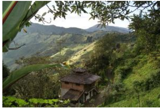
Vista hacia la comunidad y una casa adaptada con ladrillo y madera