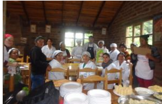
Taller de cocina con productos locales