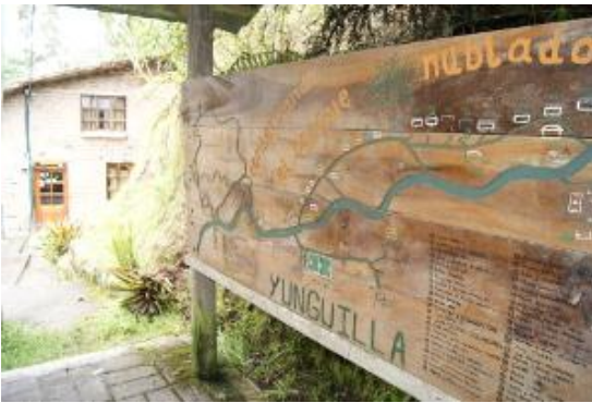
Mapa de la comunidad Yunguilla