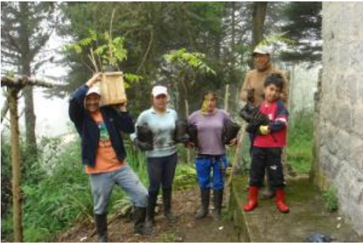
Iniciativa de reforestación