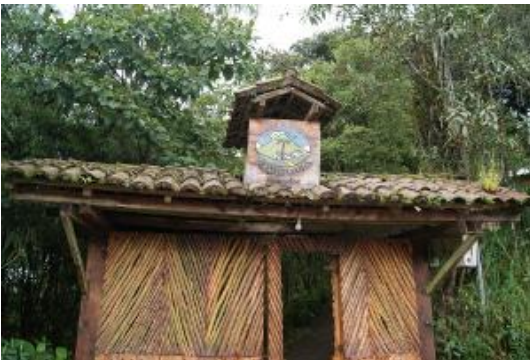
Entrada a la hacienda Tahuallullo