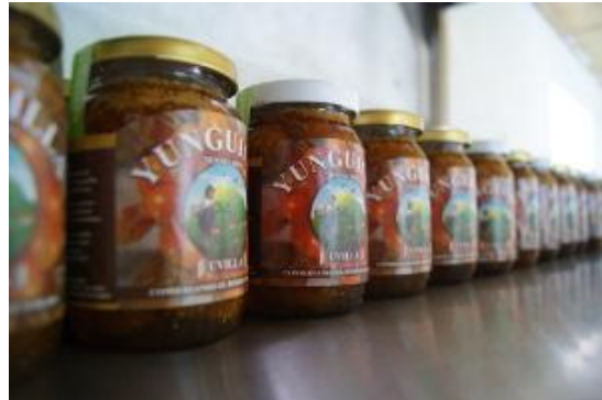
Elaboración de mermeladas