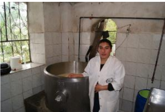
Fábrica de quesos