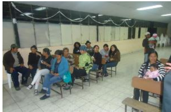
Asamblea de los socios de la Corporación