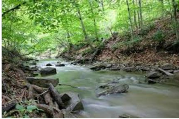
ព្រែក/អូរ

ធនធានធម្មជាតិ គឺជាធនធានដែលកើតឡើងដោយឯកឯង មានដូចជា ទឹក ដី ព្រៃ ពន្លឺព្រះអាទិត្យ ខ្យល់...។