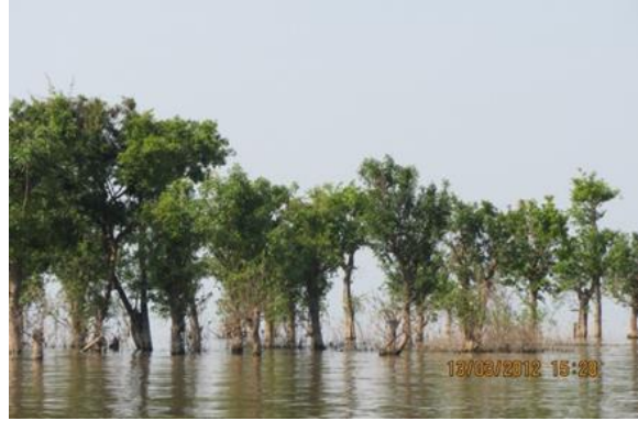
ទន្លេ និងព្រៃលិចទឹក