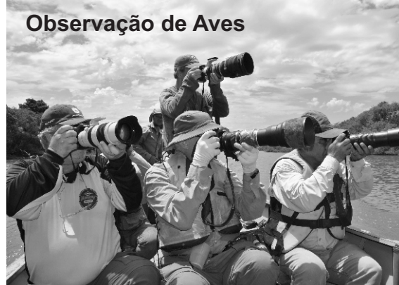
Observação de Aves