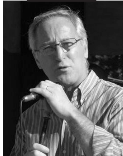
MIGUEL OLIVIERI Intendente de Monte Caseros Argentina