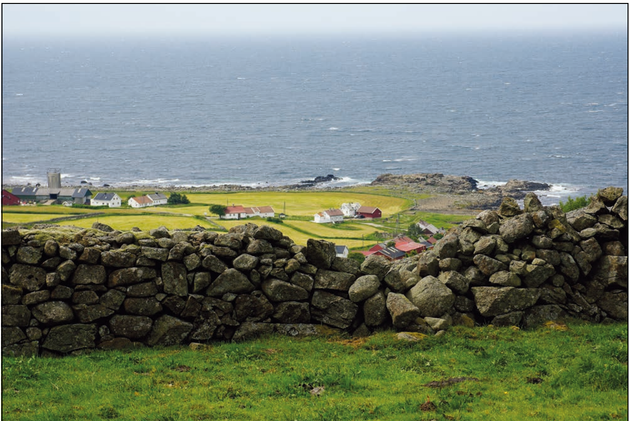
Figur 1.1 Kulturlandskap på Lista, Farsund, Vest-Agder

Gradvis har kulturminnevernet blitt et politisk område. Fram til Riksantikvaren ble opprettet i