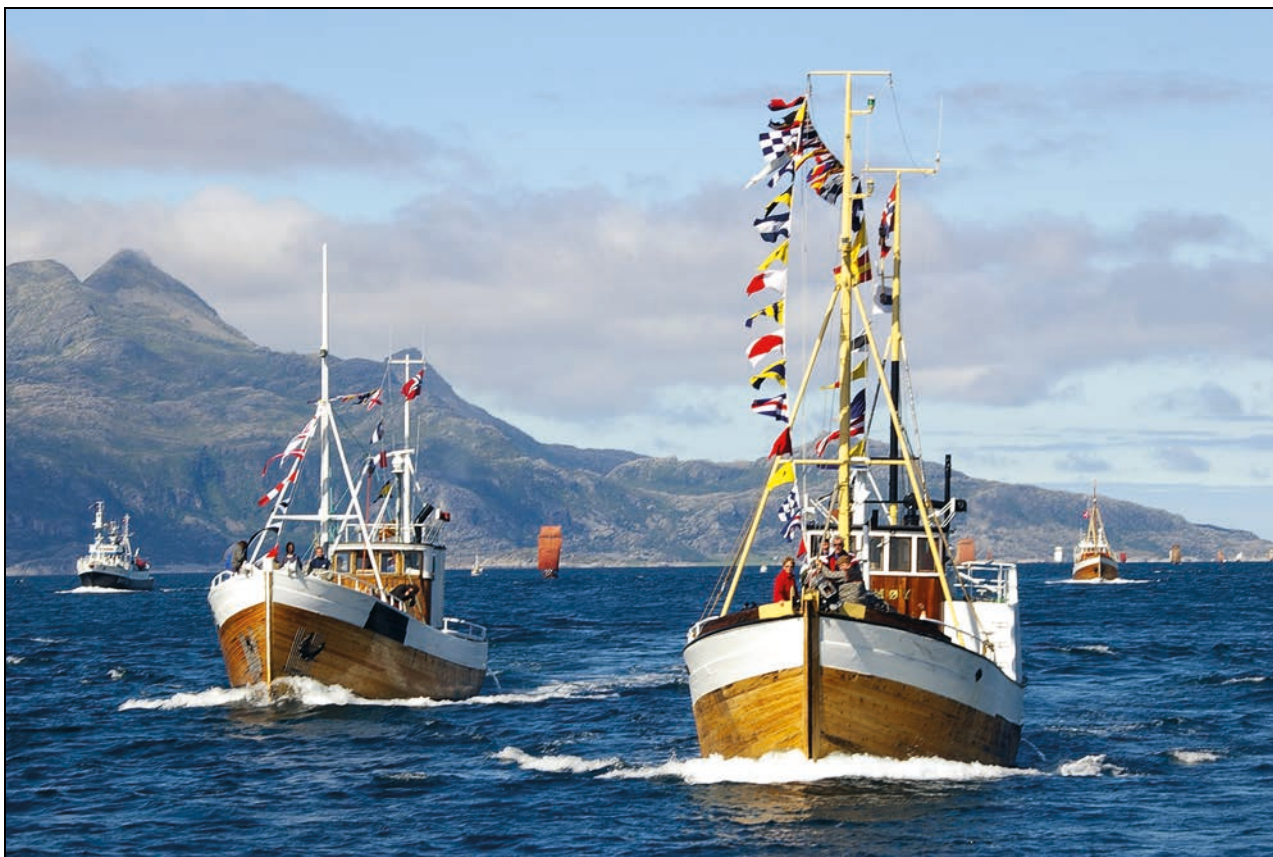
Figur 4.3 Fra Forbundet Kystens landsstevne 2006, Bodø, Nordland