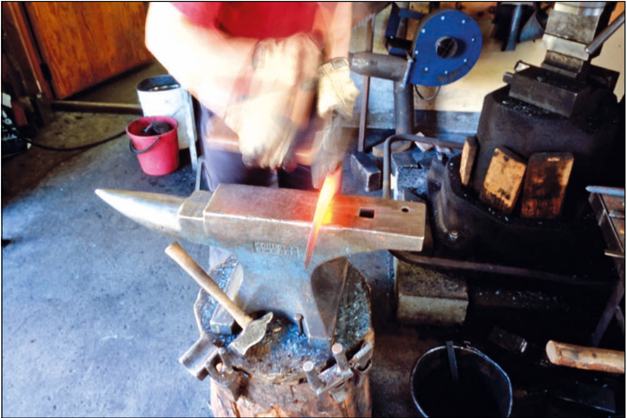
Figur 4.10 Smed i arbeid