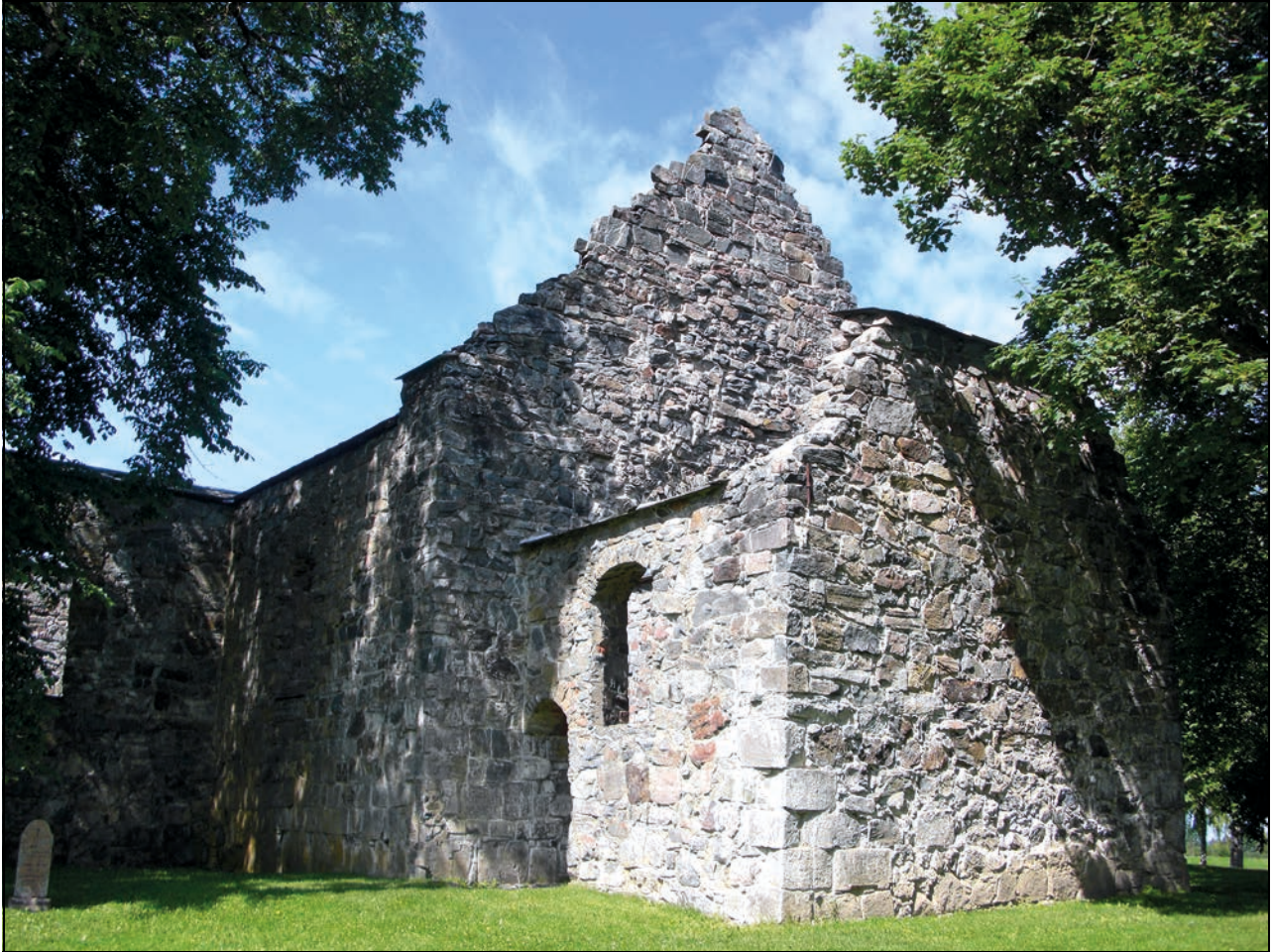
Figur 4.4 Nes kirkeruin, Nes, Akershus