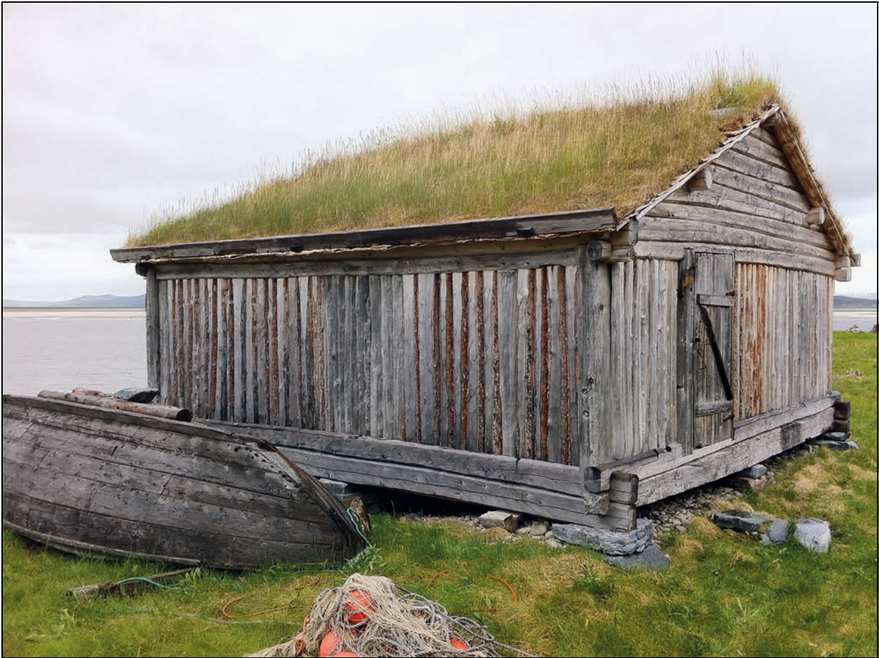
Figur 4.9 Automatisk fredet, samisk uthus i Lavonjarg i Austertana, Tana, Finnmark