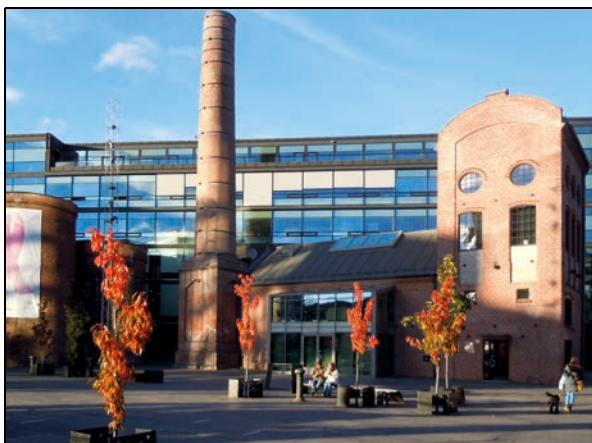
Figur 4.7 Papirbredden, Drammen, Buskerud