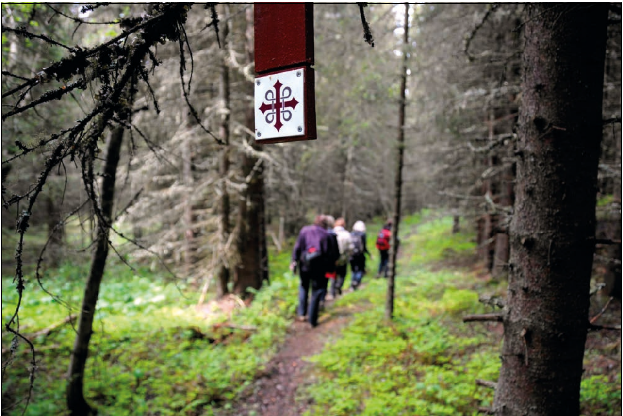
Figur 3.1 Pilegrimsleden

Prosjektene har vært finansiert i form av et spleiselag, der den statlige innsatsen har utløst andre finansieringsmidler fra fylkeskommuner, kommuner og private aktører. De offentlige mid-