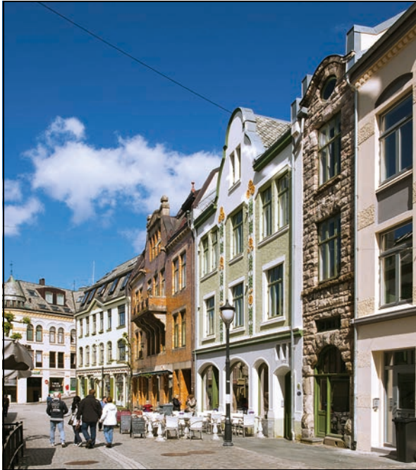
Figur 4.8 Jugendbyen Ålesund, Møre og Romsdal