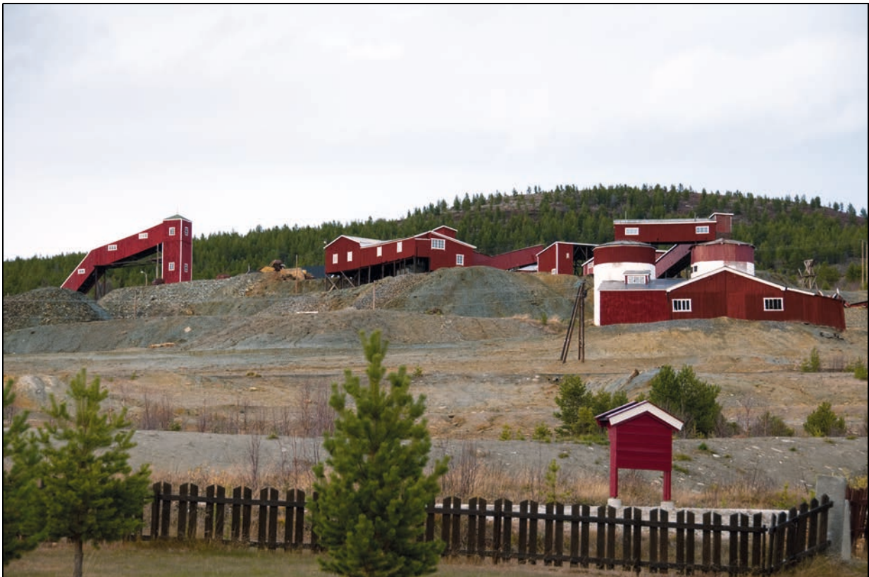
Figur 4.2 Folldal gruver, Folldal, Hedmark