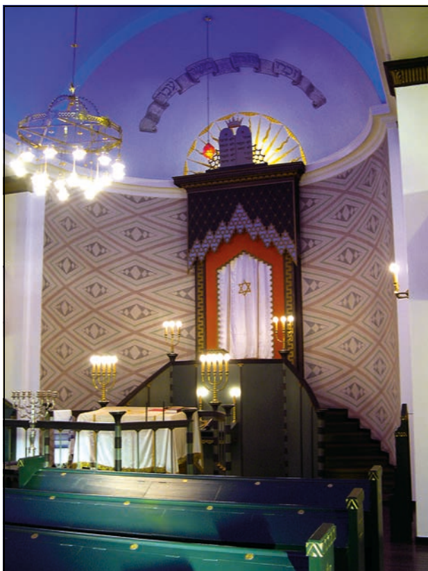
Figur 4.11 Verdens nordligste synagoge, Trond- heim, Sør-Trøndelag

Norge ratifiserte i 1999 Europarådets ramme- konvensjon om beskyttelse av de nasjonale mino- ritetene. I 2008 ratifiserte Norge også Europarå- dets rammekonvensjon om kulturarvens verdi for samfunnet, Farokonvensjonen. Denne konvensjo- nen sier blant annet at enhver har ansvar for å respektet andres kulturarv i samme grad som sin egen, og som følge av dette respektere hele Europas kulturarv.