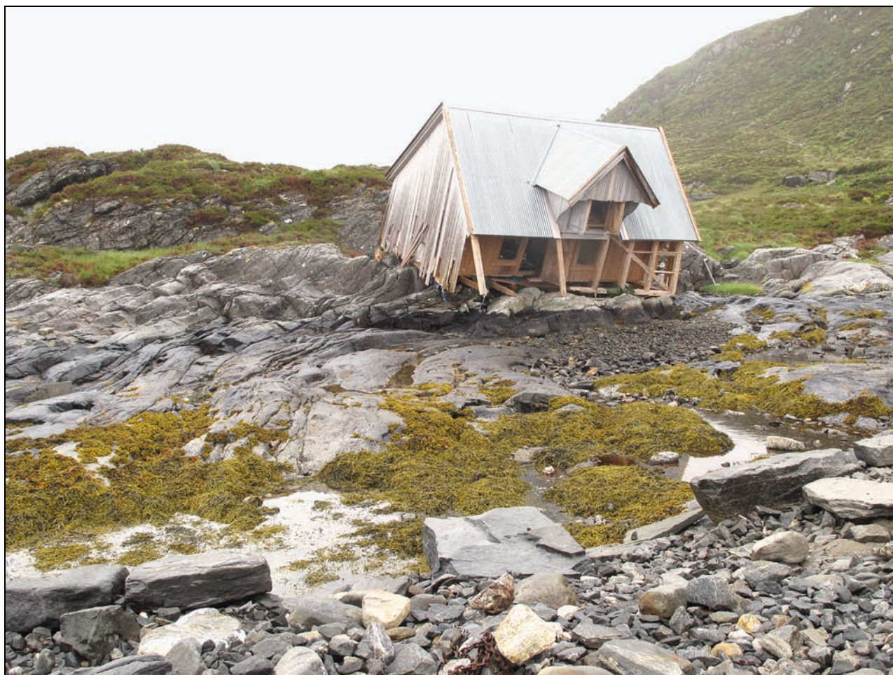
Figur 1.2 Et resultat av ekstremværet Dagmar i romjulen 2011, Selje, Sogn og Fjordane

En annen side ved en generelt høyere levestandard i verden er ønsket om opplevelser, noe som igjen fører til økende turisme. I dag er europeisk kulturarv en av verdens største turistdestinasjoner og omsetter for 335 milliarder euro. Det landet som har flest turister er Italia, et land med en lang og gjennomgripende tradisjonen for vern og bevaring. Autentiske og tilgjengelige kulturminner vil bli mer etterspurt også i Norge. For eksempel har stavkirker, trebygninger fra middelalderen, fiskevær, industriarv og moderne arkitektur med høy kvalitet en stigende etterspørselskurve i en verden som etterspør mer eksotiske opplevelser. Det samme gjelder Vestlandsfjordene og mange av dalførene og den rike kultur- og naturarven disse områdene representerer. Disse endringene kan bidra til å styrke vernet. Det vil samtidig innebære at kulturminnene i større grad blir iscenesatt og trukket inn i mer kommersielle sammenhenger. Det kan både være til berikelse, men kan også være en utfordring.