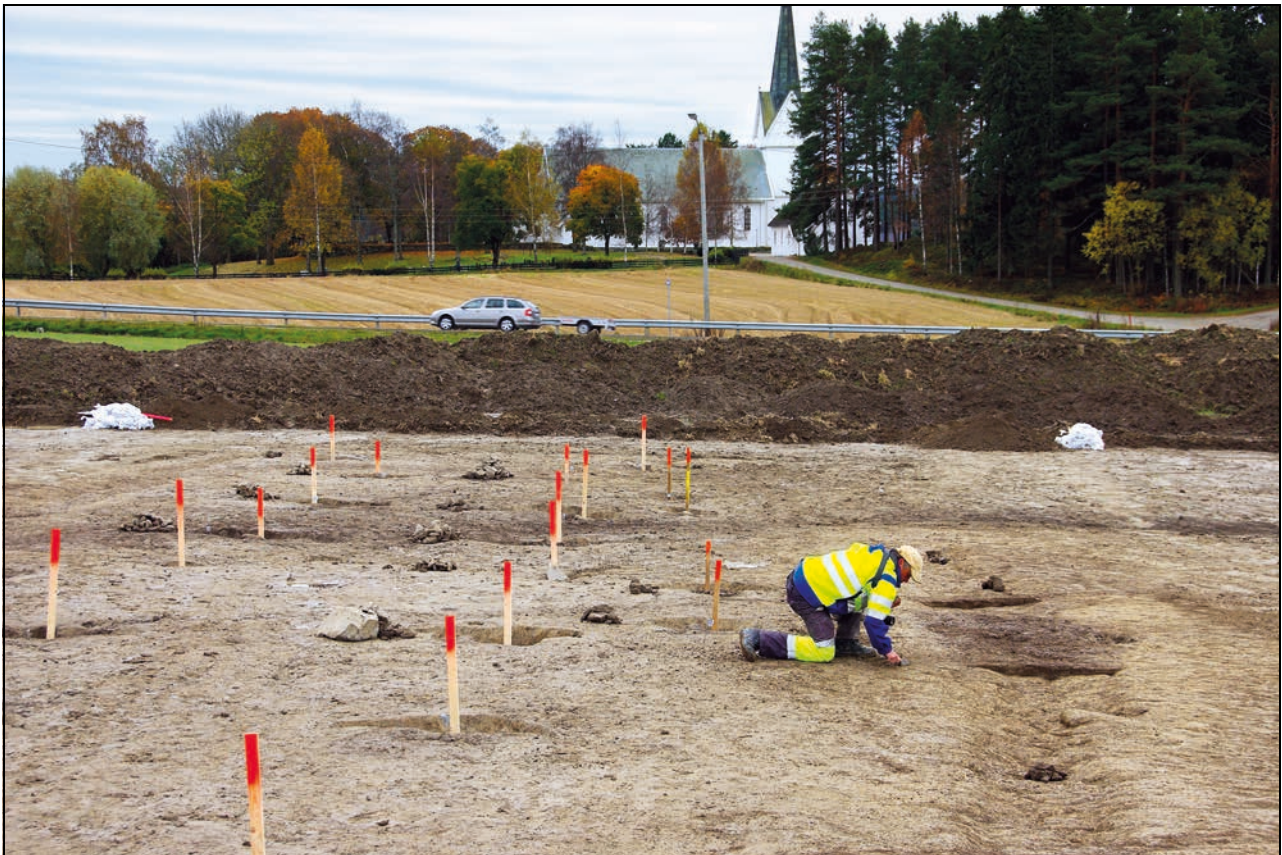
Figur 4.6 Arkeologisk utgraving i forbindelse med utbygging av ny E18 i Vestfold

Senere lovendringer har resultert i differensierte fredningsgrenser blant annet for samiske kulturminner og skipsfunn, mens andre arkeologiske kulturminner fra tiden etter 1536 ikke har hatt noe formelt vern direkte gjennom loven. Derfor er det viktig å sikre at også disse kulturminnene blir forvaltet på en god måte, jf. også kapittel 4.1.2. Både samiske kulturminner og skipsfunn har en fredningsgrense på hundre år. Når det gjelder skipsfunn er det en stor utfordring at antall fredete objekter vil øke kraftig når for eksempel skipsvrak