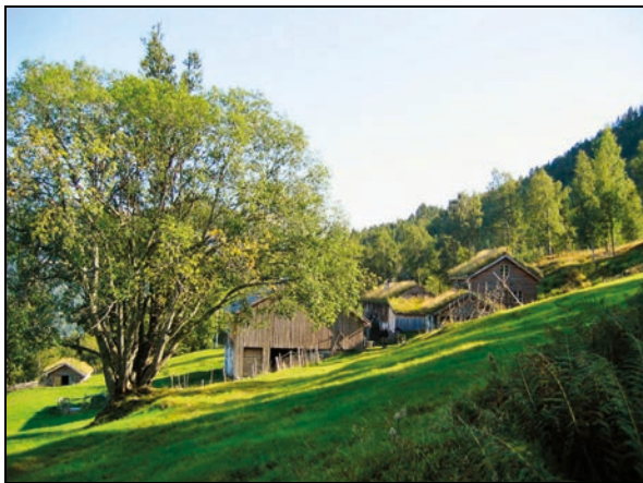
Figur 6.1 Fjellgarden Ytste-Skotet, Stordal, Møre og Romsdal, der bygningene og kulturlandskapet på gården er restaurert gjennom dugnadsarbeid og med hjelp av midler fra blant annet kulturminnefondet.