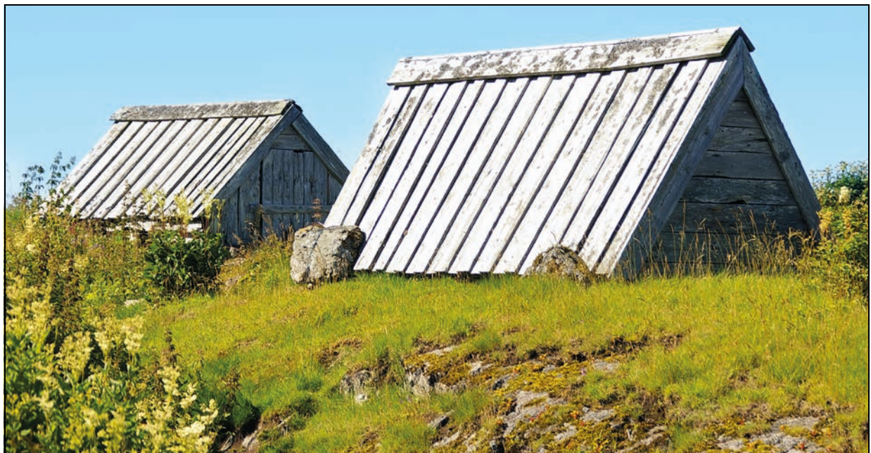
Figur 4.12 E-hus på Skjærvær, den vestlige og ytterste delen av Vegaøyen verdensarvområde, Vega, Nordland