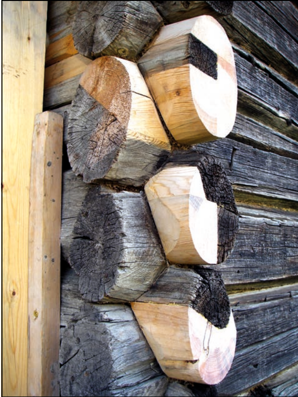
Figur 4.1 Istandsetting, Valbjør gård, Vågå, Opp-land