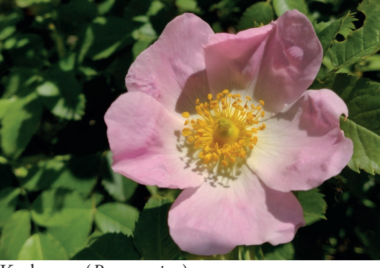
Kuşburnu ( Rosa canina )