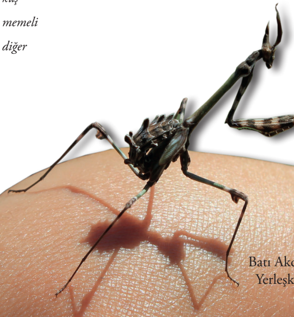
Peygamberdevesi Empusa pennata Batı Akdeniz'e özgü bu tür ODTÜ Yerleşkesi'nde gözlemlenebiliyor.