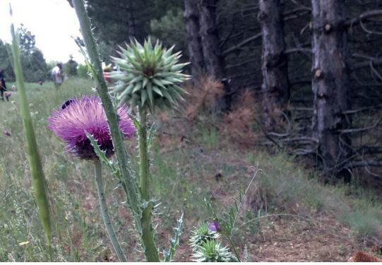
Eşekdikeni ( Carduus nutans )