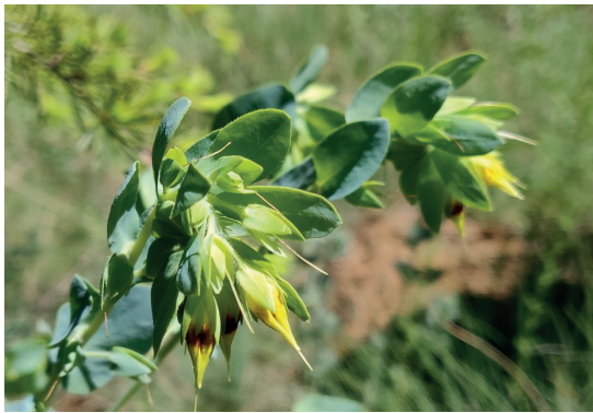
Cüzegözü ( Cerinthe minor )