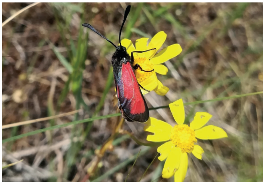
Kan güvesi ( Zygaena purpuralis )

Türkiye'nin ikinci Tür Say! etkinliği 26 Mayıs 2019 Pazar günü ODTÜ Yerleşkesi'nde gerçekleşti. Etkinliğe tüm Ankaralılar davet edildi. Tür Say! belirli süre içinde, belirlenen bir alanda yaşayan canlı türlerinin kayıt altına alındığı bir biyolojik çeşitlilik tespit çalışmasıdır. Alanında uzman doğa bilimciler, gönüllü doğa rehberleri ve vatandaşların geniş katılımıyla bir maraton şeklinde gerçekleştirilir. Amacı, bir yandan halkın doğa ve doğa koruma konularına ilgisini çekmek, bir yandan da korunması istenen alanın tür çeşitliliğini ortaya koymaktır.